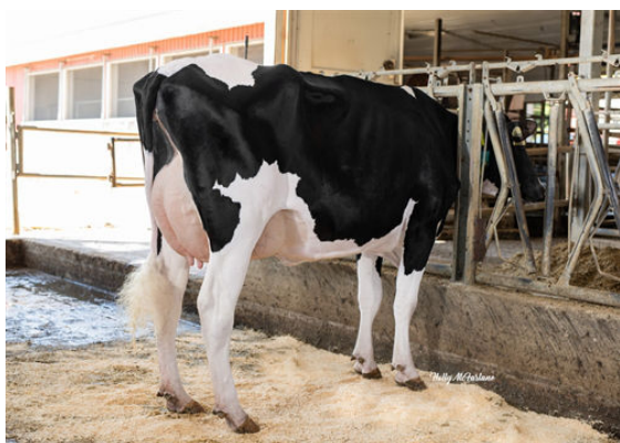
PROGENESIS GUARANT MILLIONS DAM